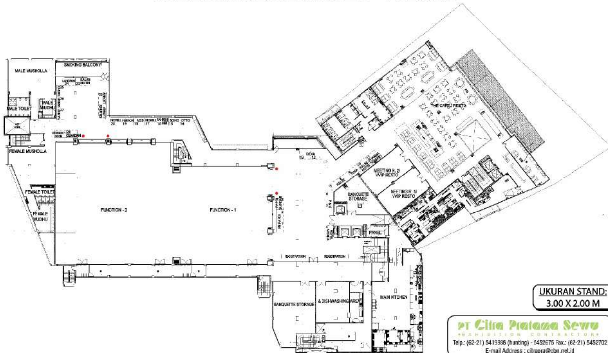
Denah Lt. 2

11 - 13 NOVEMBER 2022 THE ZHM PREMIER HOTEL - PADANG